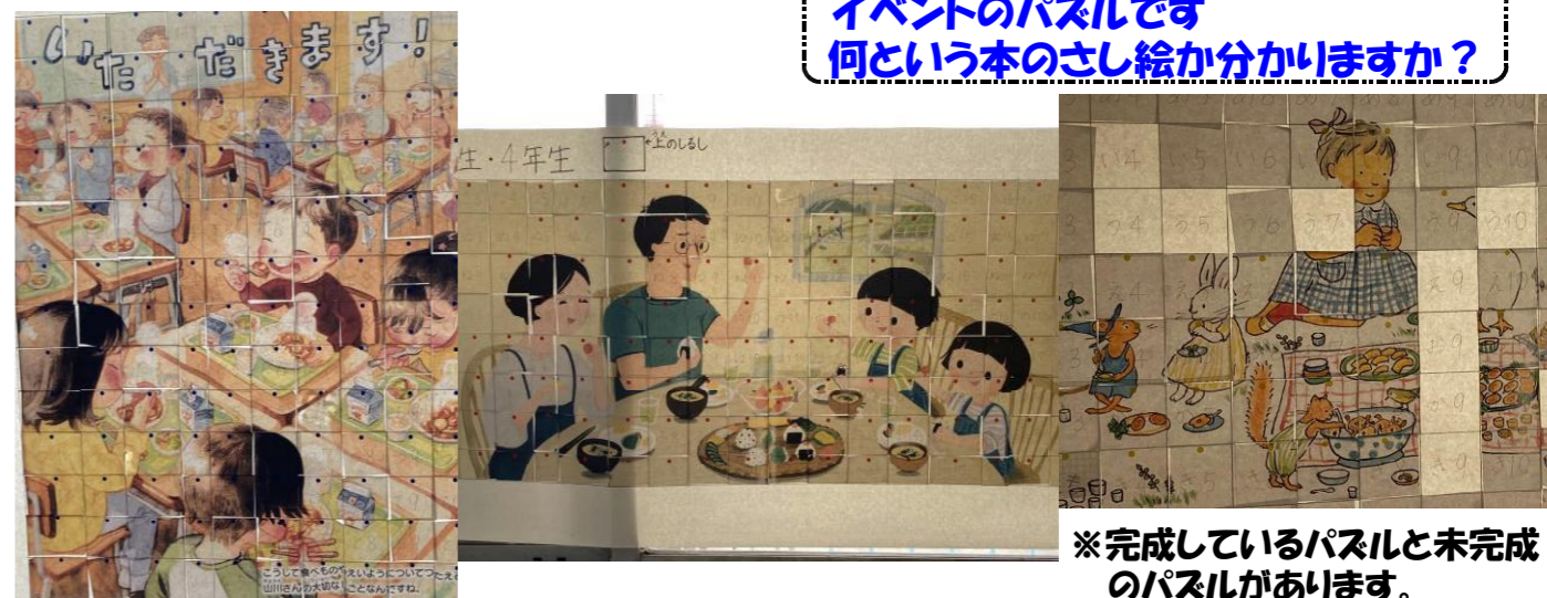
※完成しているパズルと未完成のパズルがあります。